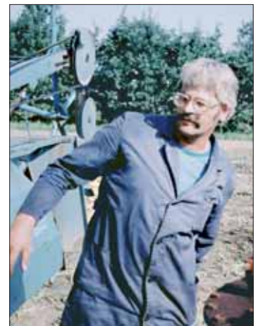
Eckhard arbeitete ebenfalls als Maschinenschlosser in der LPG?