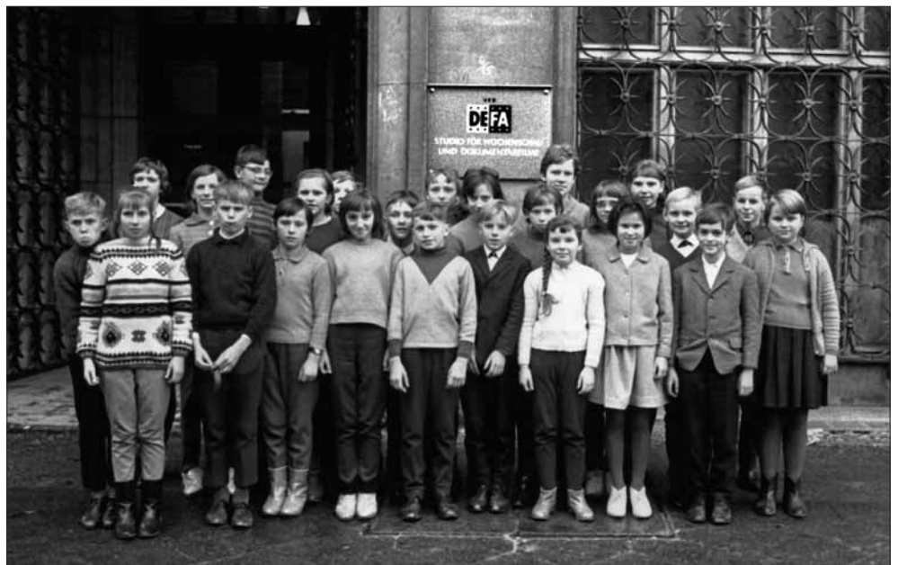
Die „Kinder von Golzow“ bei einem Besuch im Studio für Wochenschau und Dokumentarfilme in Berlin

WJ: Unsere ersten sieben Filme zeigten ja immer die ganze Klasse. Erst mit Lebensläufe widmeten wir einzelnen Kindern, die da heranwuchsen und „unter uns ankamen“, kurze