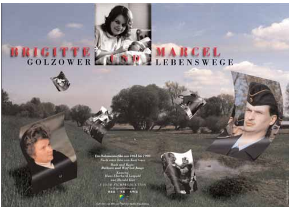
Plakat „Brigitte und Marcel - Golzower Lebenswege“ Grafik: Dettel Helmbold