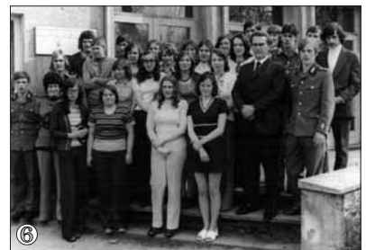
1. Wenn ich erst zur Schule geh'