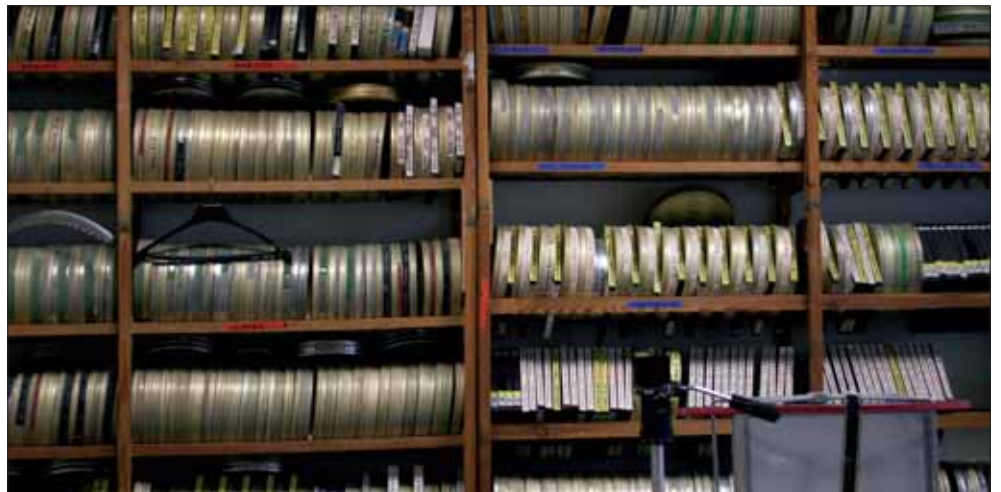
Regale voller Filmrollen zu den „Kindern von Golzow“ in den Schnitträumen in Berlin-Johannisthal