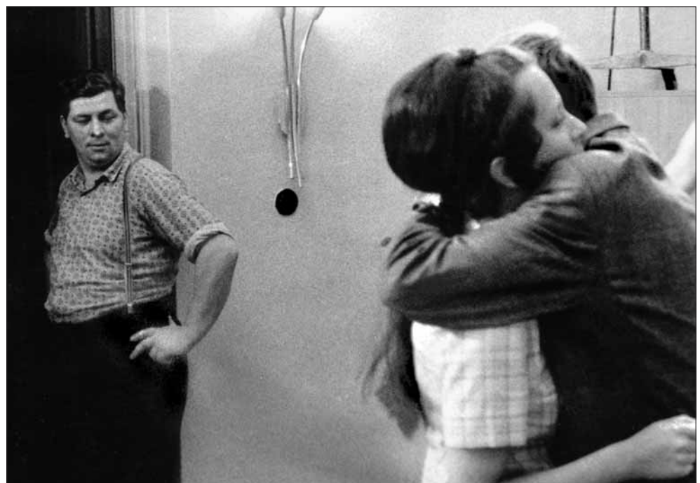
Abschlussfeier in Golzow nach zehn Jahren Schule