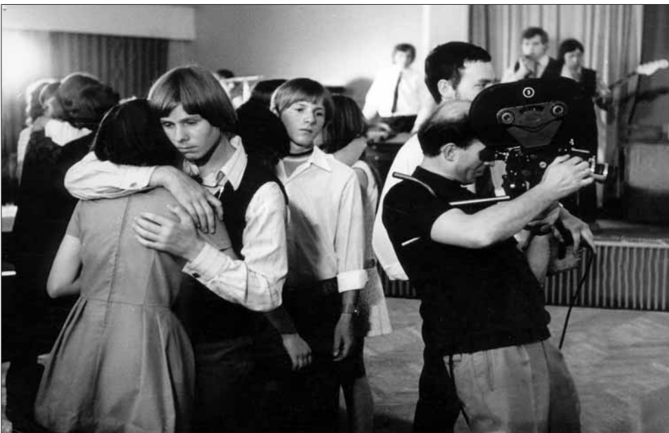
Dreharbeiten während der Abschlusfeier der 10. Klassler

Darauf konnten und wollten wir natürlich nicht eingehen und erreichten stattdessen 1986 über Egon Krenz, dass das Golzow-Projekt im Filmbereich bleiben konnte und sein jährliches Geld für die Dokumentation bekam. Ziel – ein abschließender Film zum 50. Jahrestag der DDR 1999. Und das bedeutete: Bis dahin brauchten wir nicht vorzuzeigen, was wir dafür eigentlich drehten.