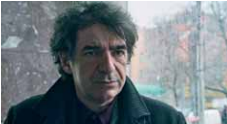
4) Ein ungeheuerliches Angebot eines mysteriösen Mannes (Miki Manojlović)