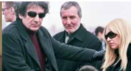
8) Der vermeintliche Freund (Miki Manojlović) kondoliert der Witwe (Anica Dobra)