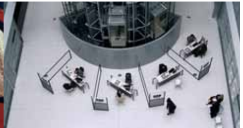
6) Die Bank verweigert den Kredit