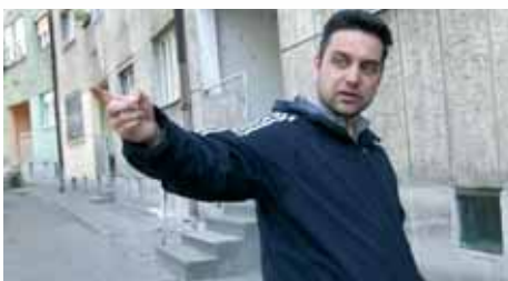
12) Arbeitsfoto: Regisseur Srdan Golubović