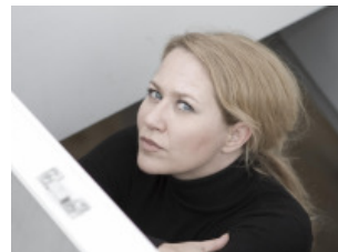
12) Portraitfoto: Regisseurin Simone Jung