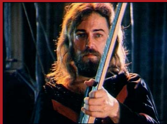
Disco-Film Nr. 14 „Die Omegas“