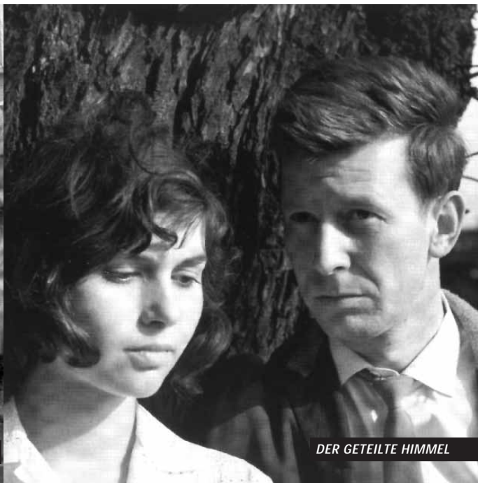
DER GETEILTE HIMMEL

DER GETEILTE HIMMEL (DEFA 1964, S/W, 110 min., FSK 16)