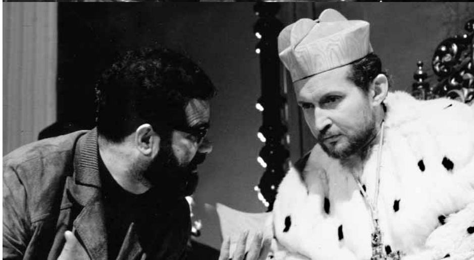
Konrad Wolf bei Dreharbeiten zu seinem ersten DEFA-Film „Einmal ist keinmal“ 1955 (Foto oben)