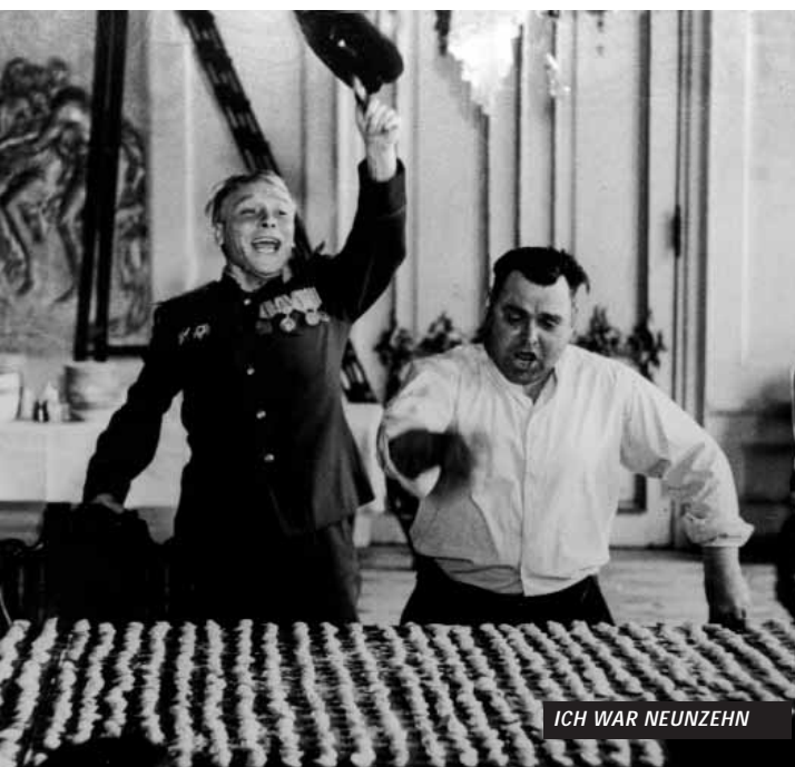
ICH WAR NEUNZEHN