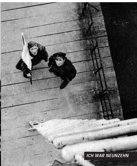
ICH WAR NEUNZEHN