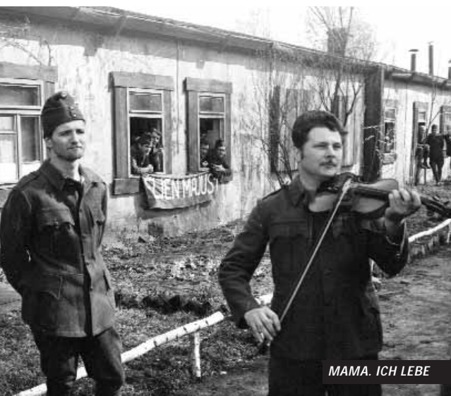
MAMA, ICH LEBE

Kassenschlager des Jahres 1978 Silbermedaille in Avellino (Italien)