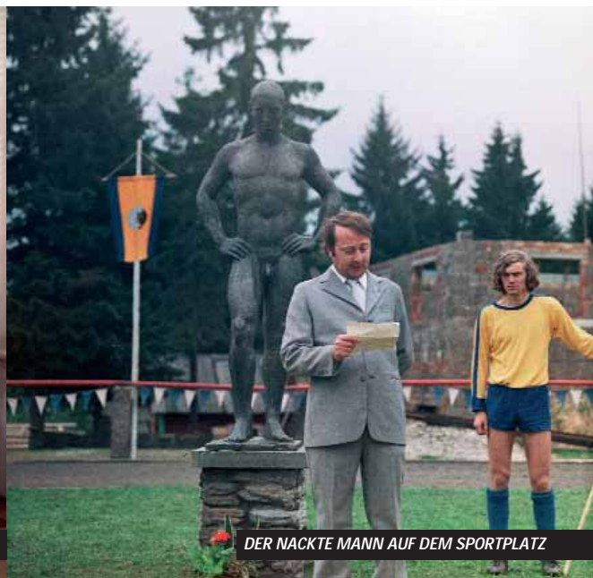
DER NACKTE MANN AUF DEM SPORTPLATZ

DER NACKTE MANN AUF DEM SPORTPLATZ (DEFA 1974, F, 101 min., FSK: 12)